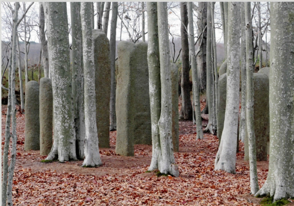
Architektur und Natur: Gegensätze im Watermill Center

M&T: Warum «Norma», Robert Wilson? Welche Ideen standen am Beginn dieses Projekts. Oder ging es nur darum, eine Lücke in Ihrem Repertoire zu füllen?